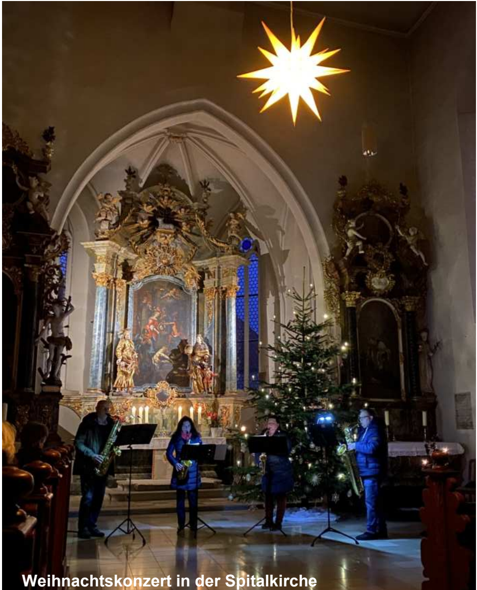
Weihnachtskonzert in der Spitalkirche

» Viele Christinnen, Christen und Kirchengemeinden tun in diesen Tagen genau das. Sie machen sich auf und werden licht für diejenigen, die dieses Licht besonders brauchen.